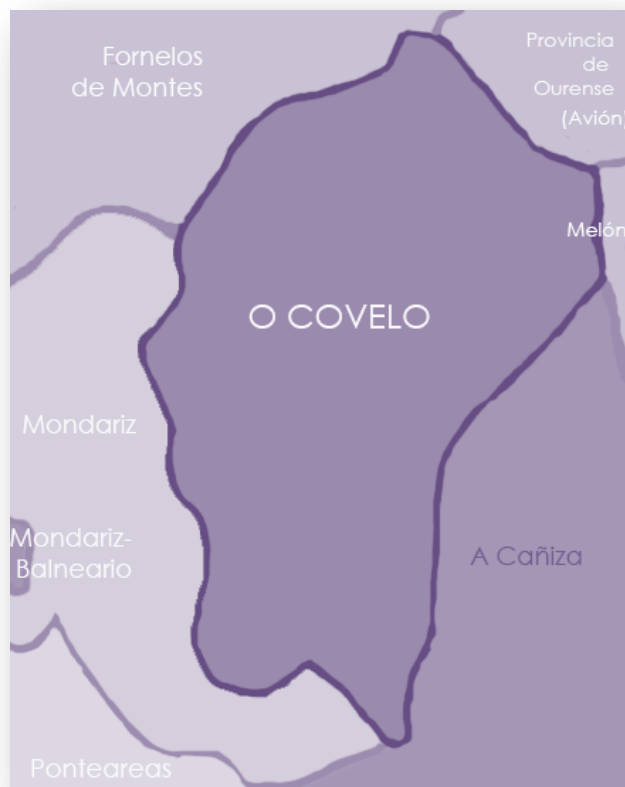
Figura 1. Situación xeográfica do concello de O Covelo

O municipio de Covelo atópase situado no sur da provincia de Pontevedra. Limita coas localidades ourensás de Avión e Melón e coas pontevedresas de A Cañiza, Mondariz e Fornelos de Montes. Conta cunha superficie 124 quilómetros cadrados, na que reside unha poboación de aproximadamente 2500 habitantes repartidos en 14 parroquias: Barcia de Mera (San martiño), Campo (Santa María) Casteláns (Santo Estevo), Santa Mariña, Fofe (San Miguel), Godóns (Santa María), A Graña (San Bernabeu), A Lamosa (San Bartolomé), Maceira (San Salvador), Paraños (Santa María), O Piñeiro (San Xoán), Prado (San Salvador), Prado da Canda (Santiago) e Santiago de Covelo (Santiago).